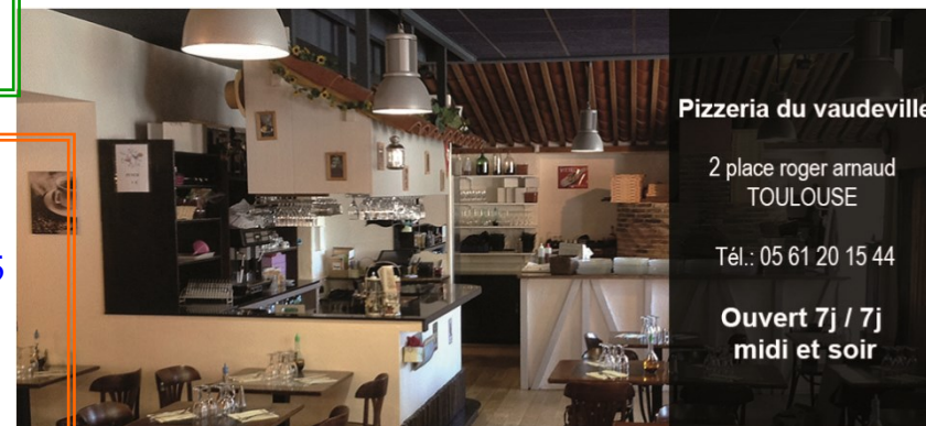
Pizzeria du vaudeville